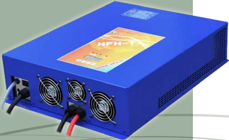
AIR SYSTEM: Pompa integrata per ricircolo dell'elettrolita.